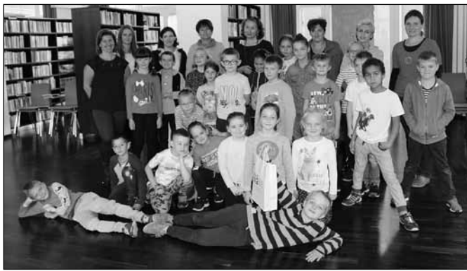
fol. MBP w Wiśle