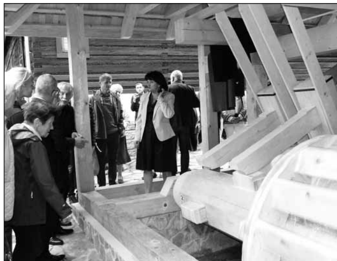
fol. Muzeum Beskidzkie

Drewniany wał – osadzony jest na bukowych łożyskach, zaopatrzone w zęby, zakończony drewnianym lub żelaznym czopem. Umożliwia podnoszenie na przemian dwóch ciężkich dębowych stęporów, które opadały na stępę. Jest połączony z kołem wodnym na zewnątrz budynku.