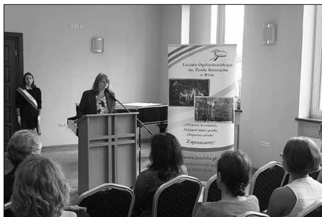
foto. LO im. P. Stalmacha