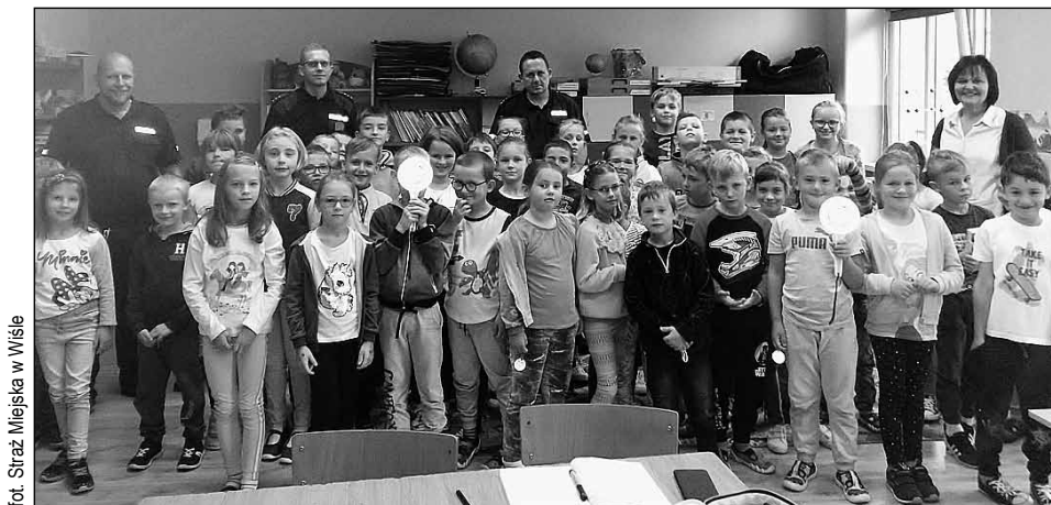
fol. Straz Miejska w Wisle

Spotkania Anonimowych Alkoholików odbywają się w lokalu Straży Miejskiej przy dworcu kolejowym Wisła Uzdrawisko w każdą środę o godz. 18:30, zaś w każdy czwartek o godz. 17:00 spotyka się tam grupa wsparcia dla kobiet „Al-Anon”. Zapraszamy!